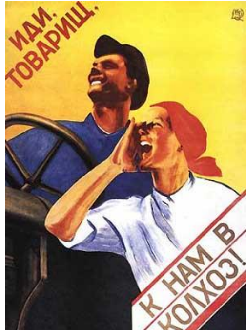
Російсько-мовна радянська пропаганда

Повстання селян. Зі збільшенням тиску на селян, активізувався селянський рух опору (peasant resistance). Від 20 лютого до 2 квітня 1930 р. в Україні відбулося 1,716 масових виступів, які об'єднували до двох тисяч людей. Люди організовувалися як могли; зброєю були вила, лопати, сокири. Натовпи селян зі співом “Ще не вмерла Україна” ліквідовували місцеві органи влади. Партиїці і комсомольці 15 втікали.